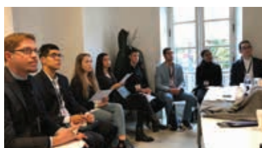
Session de recrutement Lacoste