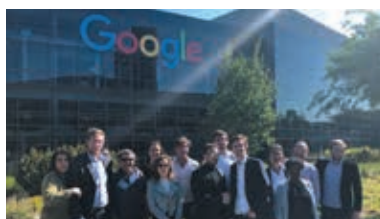
Séminaire en Innovation et Entrepreneuriat à la Silicon Valley mai 2018